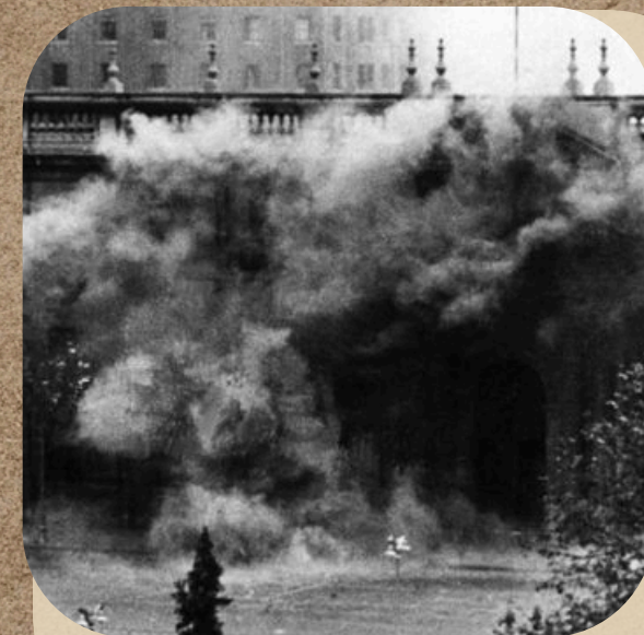
La Fuerza Aérea inicia el bombardeo de la sede de gobierno, P. Hellmich (1973)