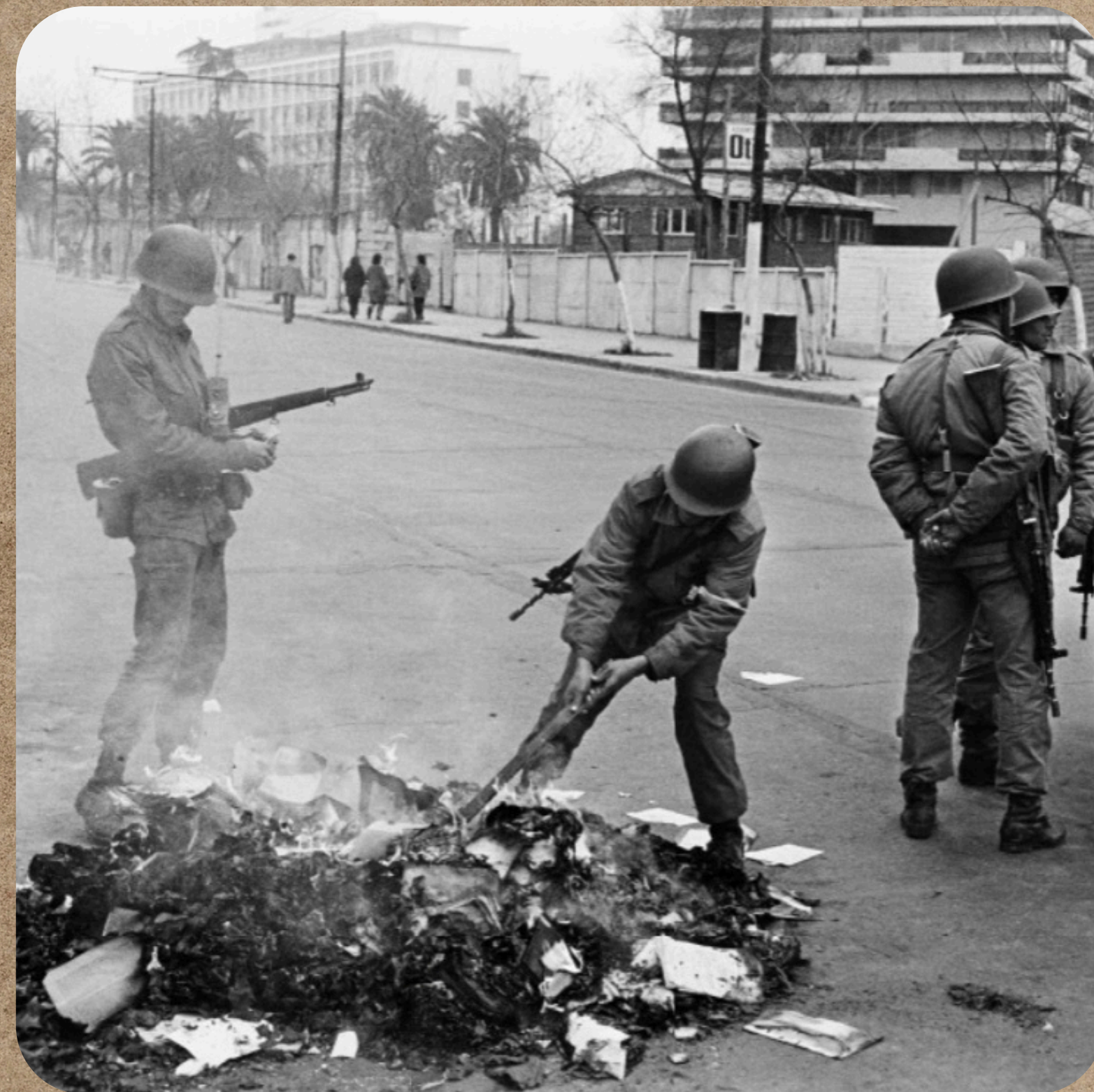
Quema de libros en la remodelación S. B. Koen Wessing (1973)

¿Qué evento histórico de las últimas décadas ha dejado fuertes huellas en el ámbito comunal, nacional, regional o global, con consecuencias a corto y mediano plazo en nuestro entorno inmediato?