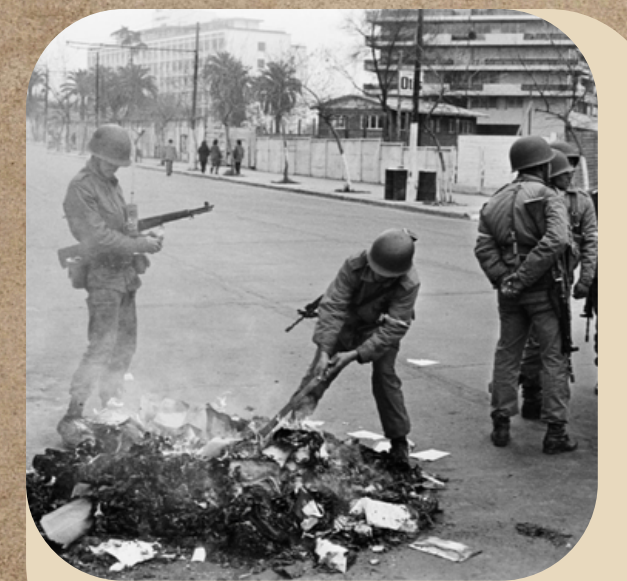
Quema de libros en la remodelación S. B. Koen Wessing (1973)