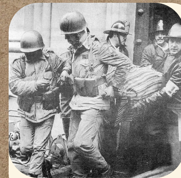
Bomberos retiran el cadáver de Salvador Allende. H. Farías (1973)